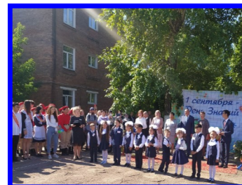
Выступление первых классов

1 сентября — это праздничный день для всех школьников, студентов и их родителей. Пусть в жизни всегда будет место знанию, мудрости, которые помогают справляться с житейскими неурядицами!