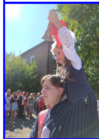
Первый школьный звонок