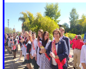
Выпускники МАОУ «СОШ № 51»